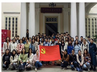
(法学院党委、物理与材料科学学院党委、生命科学学院党委)