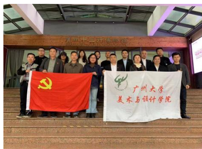
(美术与设计学院党委)

3月29日下午，网络安全学院研究生第一党支部与本科生党支部开展党建共联共建。两个支部的学生党员共同参观了学校的党建红色文化长廊，以时间为线索重温党的百年光辉历程，对中国共产党人的精神谱系有了新的认识体会。参观结束后，研究生党员与本科党员开展对接帮扶工作，针对专业学习、校园生活、择业交友等方面的问题进行答疑解惑、经验分享。经过本次活动，两个支部的党员们进一步强化了理论武装，更加坚定了永远跟党走的决心，同时也对大学生生活规划有了新的思路 and 想法。