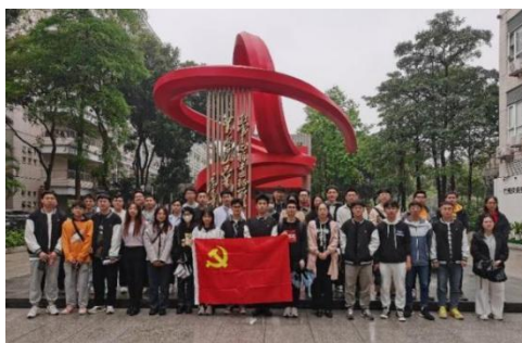
(网络安全学院党委)

3月29日下午，网络安全学院研究生第一党支部与本科生党支部开展党建共联共建。两个支部的学生党员共同参观了学校的党建红色文化长廊，以时间为线索重温党的百年光辉历程，对中国共产党人的精神谱系有了新的认识体会。参观结束后，研究生党员与本科党员开展对接帮扶工作，针对专业学习、校园生活、择业交友等方面的问题进行答疑解惑、经验分享。经过本次活动，两个支部的党员们进一步强化了理论武装，更加坚定了永远跟党走的决心，同时也对大学生生活规划有了新的思路 and 想法。