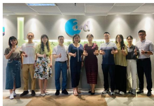
(美术与设计学院党委)