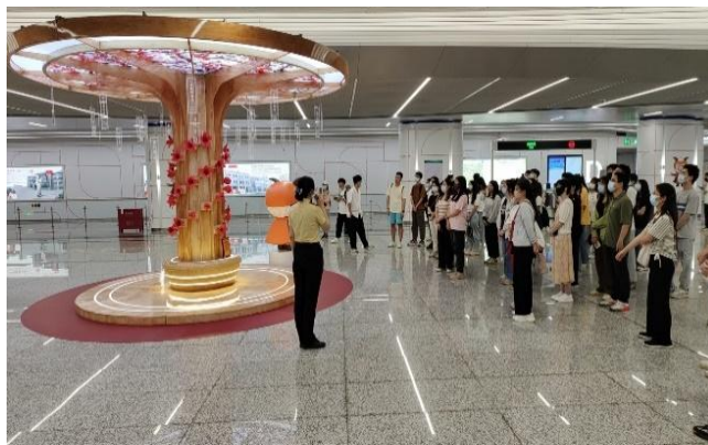
(物理与材料科学学院党委)

造了沉浸式、互动式的保密普法氛围。在工作人员带领下，全体党员同志集体参观了“机事慎密”“密述古今”“龙潭密史”“羊城防线”四大板块内容，认真聆听老一辈党和国家领导人对保密工作的论述，了解中外各个历史阶段的多种保密手段和保密历史知识，学习了我党红色保密历史，让大家充分认识到了保密工作的重大意义，明白了毛泽东同志讲到的：“必须十分注意保守秘密，九分半不行，九分九也不行，非十分不可”的深刻内涵。