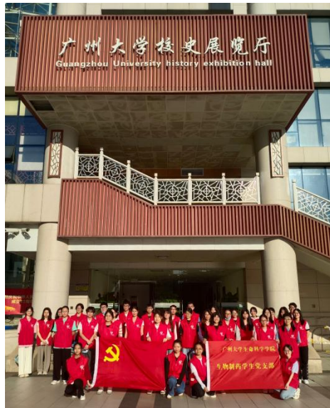
(生命科学学院党委)

血脉源流，让同学们深切感悟建校初创办者的家国情怀，增强作为广大人的自豪感和归属感。