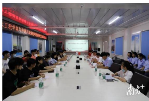
(土木工程学院党委)

9月23日，体育学院行政党支部联合化学化工学院行政党支部、分析科学技术研究中心党支部，赴番禺大岭村和广汽埃安新能源汽车有限公司，开展“传承岭南文化，发展创新科技”主题党日活动。