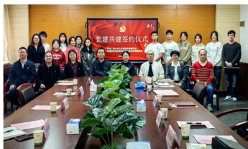
(公共管理学院党委)

座谈交流结束后，双方签署党建共建协议书并合影留念。此次共建活动，加强了基层党组织思想和成果交流，有效整合双方在平台阵地、信息建设、发展成效、人才培养等多方面资源优势，进一步拓展基层党组织功能，实现双方党建和各项工作全面提高，共同谱写党建新篇章。