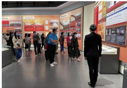
(继续教育学院党总支、法学院党委)