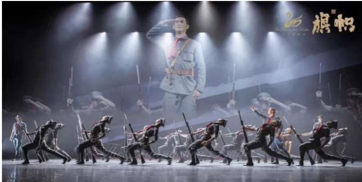
(音乐舞蹈学院党总支)

戏剧张力和中国芭蕾的艺术魅力中感受革命信仰的力量，进一步坚定作为一名党员的理想信念。