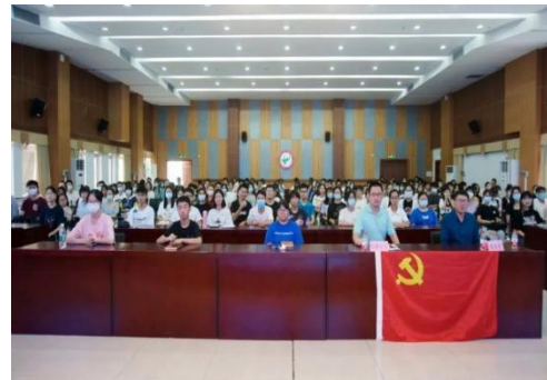
（地理科学与遥感学院党委）